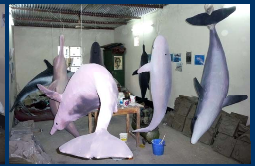
We constructed models of all seven species of small cetaceans recorded in Bangladesh.